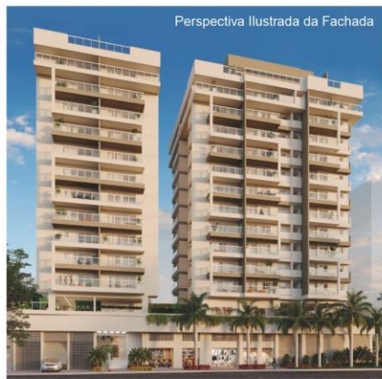
Perspectiva Ilustrada da Fachada

1.661,64m 2 de área de terreno 131 unidades, sendo: 05 lojas de 24,53 a 34,66m 2 121 apartamentos de 71,35 a 104,83m 2 05 aptos. cobertura de 140,82 a 235,82m 2 127 vagas